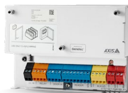
Axis A1210 barebone Powered by Genetec