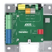
Axis A1610 barebone Powered by Genetec