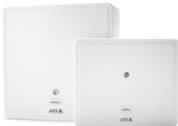
Axis A1610 Powered by Genetec