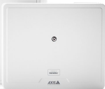
Axis A1210 Powered by Genetec